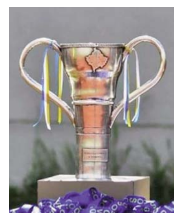
KUPA E KOSOVËS

PRISHTINË, 6 PRILL - Sot (e enjte) do të zhvillohen dy ndeshjet e para gjysmëfinale të Kupës së Kosovës në futboll. Prishtina dhe Llapi do të përballen në mes vete në kryeqytet në duelin kryesor të kësaj faze, kurse ballafaqimi tjetër është ai në mes të Dritës me Ramiz Sadikut. Gjilanasit shihen si favoritë për të kaluar në finale, edhe pse duhet të priten dy përballjet pasi, siç dihet, në këtë fazë luhet me sistem vajtje/ardhje. Fituesi i Kupës e siguron daljen në Evropë dhe për këtë arsye kjo garë është bërë edhe më interesante dhe më joshëse vitet e fundit. Fitues aktual i Kupës së Kosovës është Llapi.