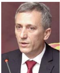
Shkruan: Prof. dr. Sabit SYLA