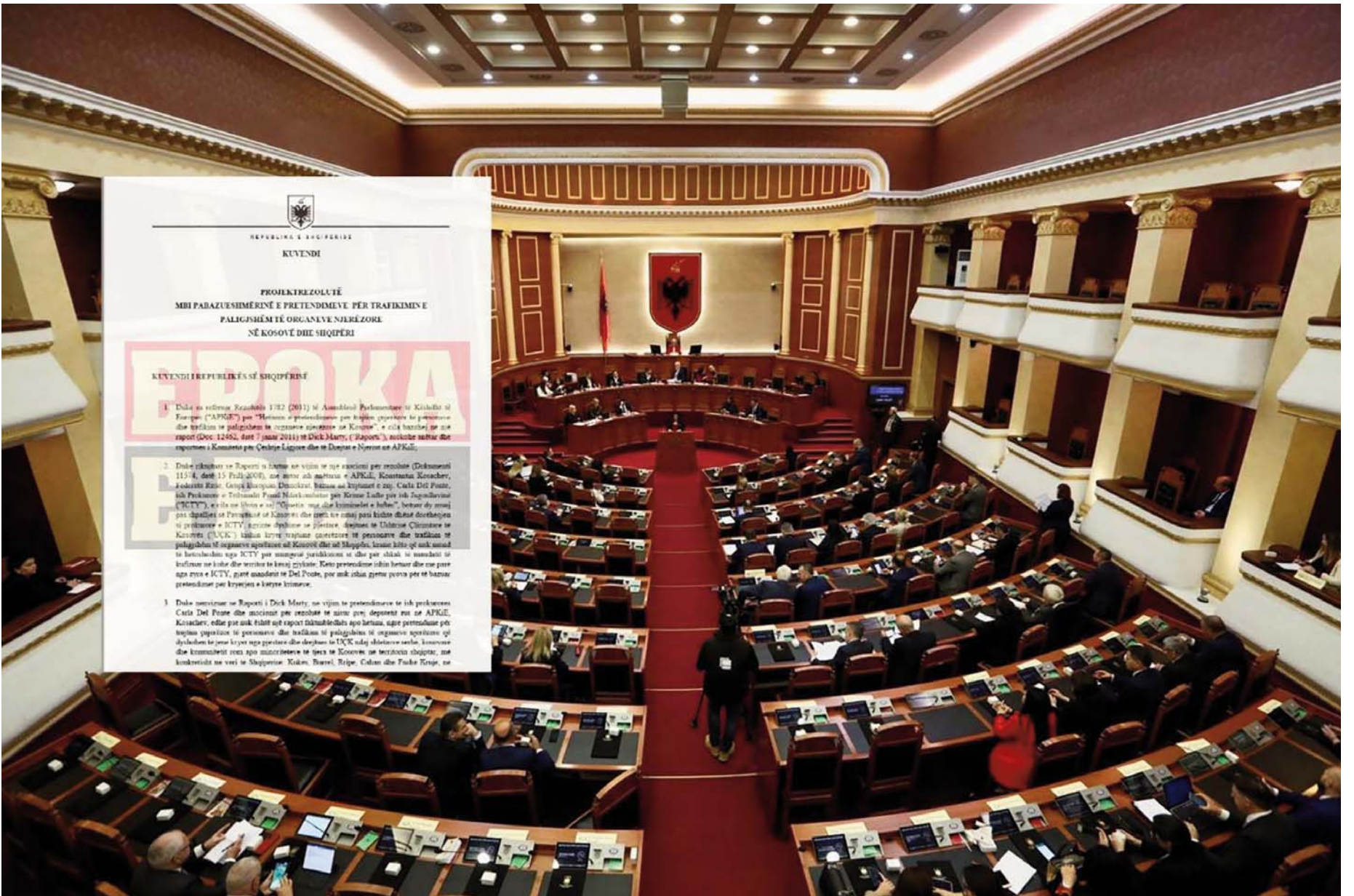
PARTIA SOCIALISTE E DËRGON NË KUVENDIN E SHQIPËRISË PROJEKTREZOLUTËN KUNDËR RAPORTIT TË DICK MARTYT