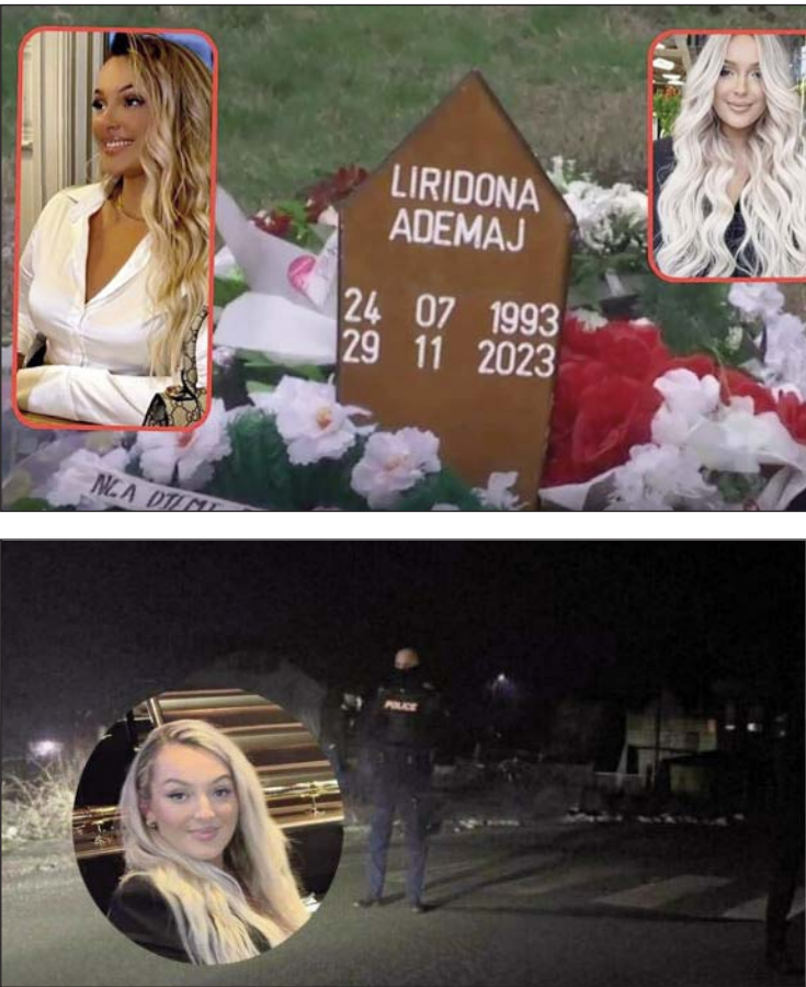
“Burime të 'Betimit për Drejtësi' bëjnë me dije se i dyshuari Murseli ia kishte dhënë të dyshuarit G. P. 15 mijë euro para vrasjes, 15 mijë të tjera do t'ia jepte pas kryerjes së veprës”, është thënë në raportimin