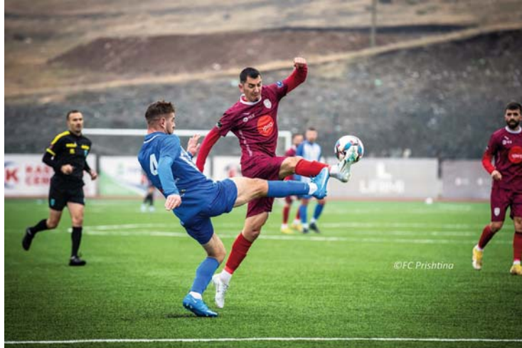
Liria u mposht nga Rilindja 1974 kohën e rregullt dhe pas pas penalltive, 4-5, pasi ndeshja në vazhdimëve u mbyll 2-2.