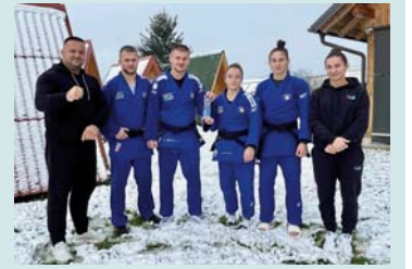
Presim përkrahje nga tribunat për kampionët tanë! Foto nga përgatitjet finale për evropianin absolut!", ka shtuar Kuka.

Kategoria e femrave deri 57 kg, përveç dy kampioneve tona olimpike, do të marrin pjesë nga elita botërore edhe shumë medaliste botërore e evropiane!", ka shtuar Kuka. Trajneri i ekipit të xhudos së Kosovës ka thënë se pret përkrahje nga tribunat për kampionët e Kosovës. "Pallati i Rinisë me datë 16 dhjetor do t'i shohë yjet e sportit të xhudos.