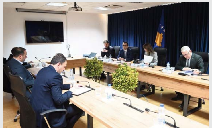
në profilin përkatës (krim fajde etj)", ka njoftuar ekonomik, pastrim parash, Ministria e Drejtësisë.

takim u ritheksuan zëshëm kompetencat dhe përgjegjësitë që Koordinatorin Kombëtarë për Luftimin e Krimit Ekonomik ka, veçmas për raportim përpara këtij Bordi. Nga kjo mbledhje u konstatua se duhet sa më parë të bëhet interpretimi i dispozitave për sekuestrimin dhe konfiskimin, qartësim dhe përmirësim të politikave ndëshkimore, si dhe u theksua nevoja për të mbajtur trajnime me zyrtarët përkatës