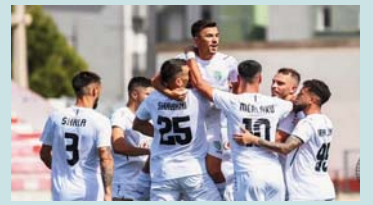
ekipin, duke shënuar edhe në ndeshjen e fundit të tij të Dukagjinit ndaj Lirisë.

golashënuesi më i mirë i ekipit me katër gola të shënuara dhe vendimtar në ndeshjet ndaj Europa FC dhe kalimin tutje në raundin e dytë të Ligës së Konferencës. Edhe në sezonin e dytë (2023-2024) Caja ka shënuar 4 gola për