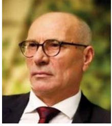
Shkruan: Muharrem NITAJ

Pse po sulmohet kaq ashpër kryeministri se po i prish marrëdhëniet me partnerët strategjikë, posaçërisht ShBA-në.