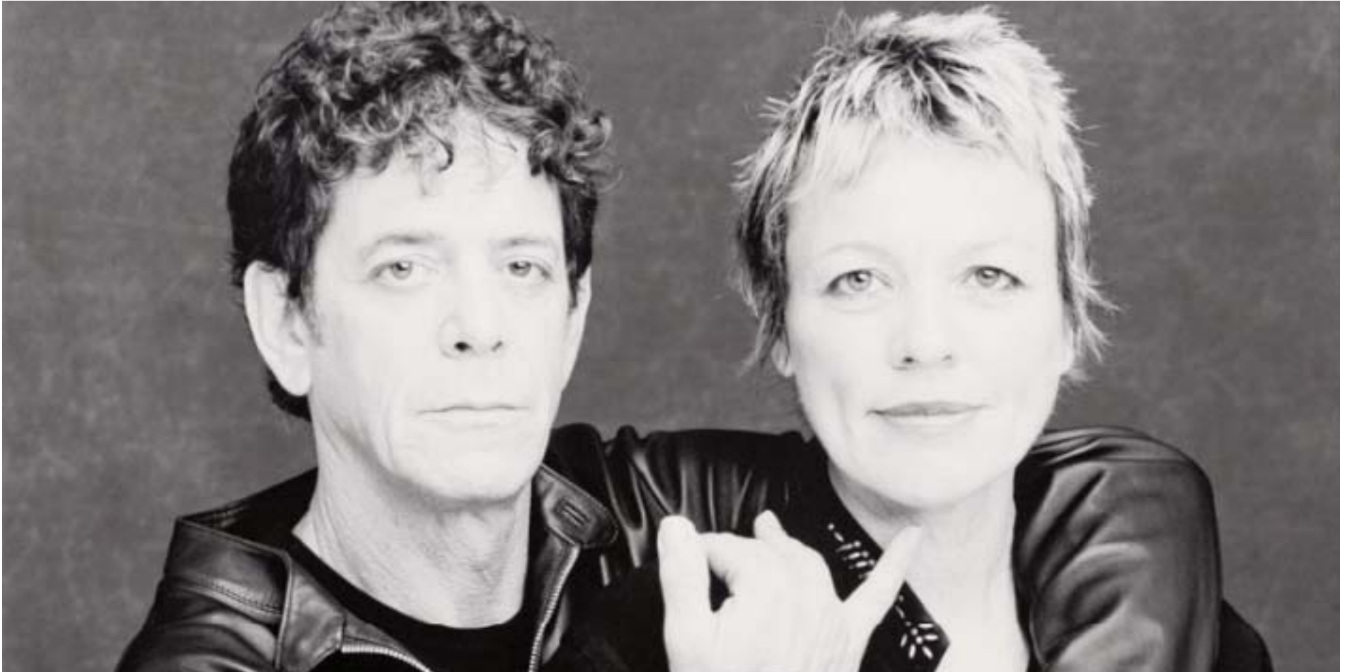
Lou Reed (1942–2013) dhe Laurie Anderson (1947) në një fotografi të vitit 2000