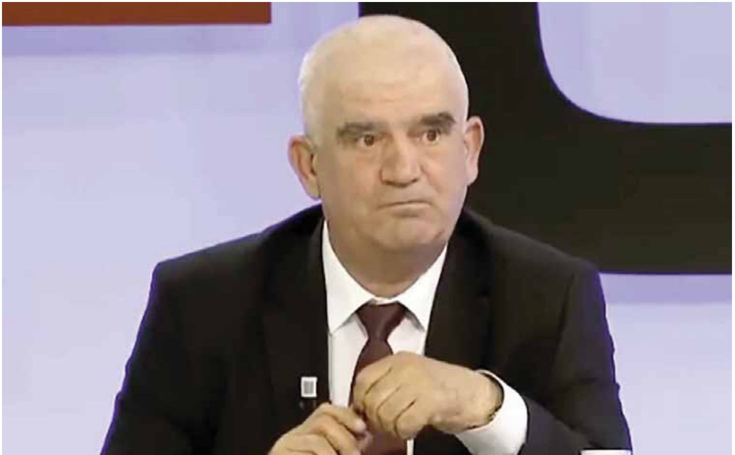
Shkruan: Kudusi LAMA