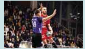
Ndeshje e fortë pritet të jetë edhe ajo që luhet në Gjakovë në mes të Shqiponjës dhe Ferizajt.

mars, ndërsa janë disa sfida interesante. Fituesi në fuqi i Kupës dhe kampioni aktual, Istogu, do të sfidohet nga Prishtina në kryeqytet. Samadrexha e pret Kastriotin, ndërsa Vushtrria luan si vendase ndaj Jusuf Gërvallës.