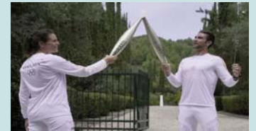
franceze Laure Manaudou, e cila fitoi titullin e saj të parë olimpik në 400 m stil i lirë në Lojërat Olimpikë "Athinë 2004".

cilat reflektohen në një pasqyrë cilindrike parabolike, duke lëshuar nxehtësi të fortë e cila ndez flakën. Sportisti i parë grek që do ta mbajë pishtarin lart do të jetë Stefanos Ntouskos, kampion olimpik i kanotazhit në Tokio 2020. Më pas, ai do t'ia pasojë flakën olimpikë notares