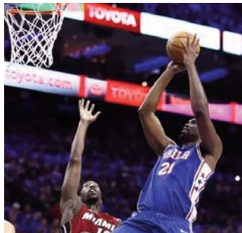
duke siguruar një vend në fazën "play-off". Një ndeshje me

PHILADELPHIA, 18 PRILL - Philadelphia e mposhti me 105-104 Miamin në sfidën "play-in" të Konferencës së Lindjes në NBA,