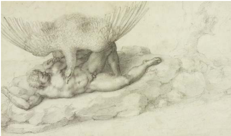
I mbushur me epsh ... "Ndëshkimi i Titit"

Lordi Elgin, na ke zhgënjyer. Nga të gjitha kryeveprat e artit botëror që koleksionistët grabitqarë të Britanisë rrëmbyen këtu dhe atje, a nuk mund ta merrje një statujë të Mikelanxhelos [Michelangelo Buonarroti]? Jo, e vetmja vepër origjinale në mermer nga skulptori, piktori, arkitekti dhe poeti i madh në një koleksion britanik, është një relief në pronësi të Akademisë Mbretërore. Ajo që ne kemi janë posedimet e vizatimeve të tij në Muzeun Britanik dhe në Koleksionin Mbretëror. Fatkeqësisht, përdorimi i këtyre veprave në letër nga Muzeu Britanik, në përpjekjen për të ndriçuar jetën e tij të