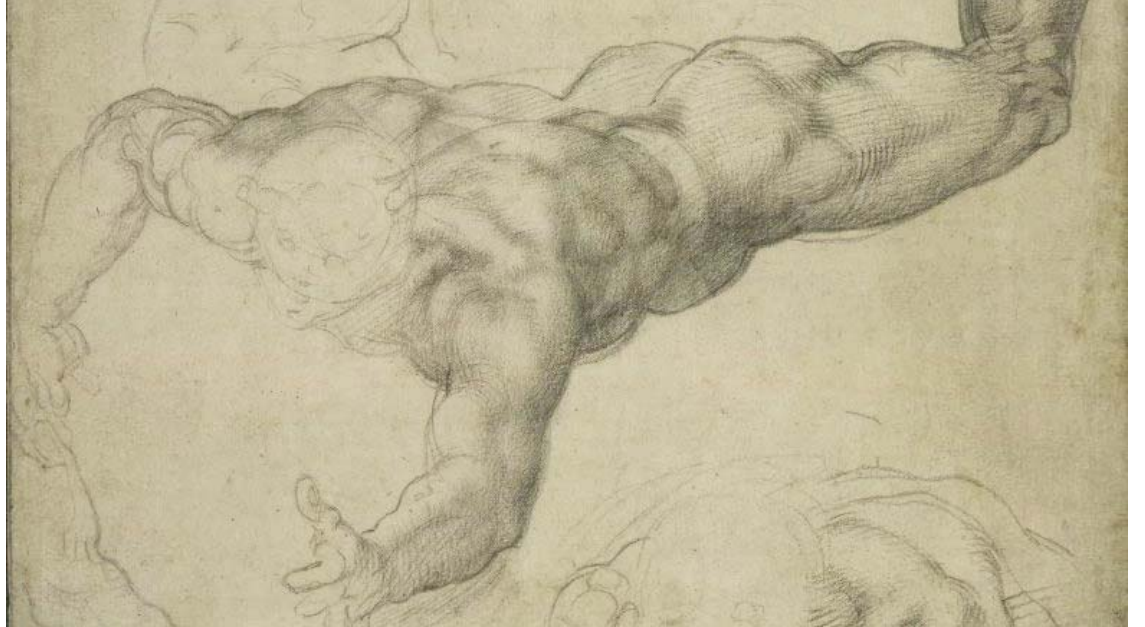
Studim i Michelangelos për "Gjykimin e fundit"

Megjithatë, kjo nuk duhet të na bëjë të shurdhër ndaj ekspozitës së vizatimeve të tij. Ekspozita e heq dramën nga jeta. Nuk përmendet rreziku dhe konflikti që mbërtheu Gjykimin e fundit , një kryevepër kjo shumë personale. Edhe kur ishte duke e pikturuar, u akuzua se e ktheu Kapelën e Papës në "hamam" duke e mbushur me nudo. Nuk ka asnjë aluzion këtu për thashethemet e bazuara se Mikelanxhelo tërhiqej seksualisht nga burrat. Aty pranë ekspozitës shfaqen