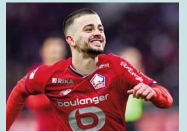
evropiane, duke përfshirë Romën dhe Juventusin.

të gjithëve për mbështetjen që më keni dhënë gjatë gjithë sezonit! Le ta përfundojmë kampionatin me fitore të dielën", ka shkruar ai në Instagram. Zhegrova me paraqitjet e tij ka zgjuar interesim të madh nga disa skuadra të ndryshme