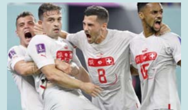
futbollistëve do të publikohet më 7 qershor.