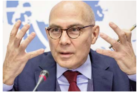
Rohingya, dhe tani në gjykatën e Kombeve të Bashkuara po trajtohet një rast nën dyshim të për gjenocid për atë periudhë.

autonomisë dhe kontrollit të burimeve natyrore. Ushtria Arakan pretendon se po lufton për më shumë autonomi për popullatën etnike të rajonit Rakhine. Luftimet janë përhapur në 15 prej 17 vendbanimeve prej muajit nëntor të vitit të kaluar dhe prej atëherë janë vrarë qindra njerëz dhe rreth 300 000 janë plagosur. Turk i ka bërë thirrje Bangladeshit fqinj që ta rrisë mbrojtjen për "njerëzit e cenusëm që kanë nevojë për siguri". Përleshjet mes ushtrisë Arakan dhe ushtrisë së shtetit më 2019 patën rezultuar me zhvendosje të rreth 200 000 njerëzve. Në atë rajon ushtria e shtetit pati nisur shtypjen e minoritetit