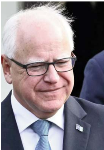
Kuvendin e partisë në Çikago.

Në një deklaratë pak para mesnatës, Komiteti Kombëtar Demokrat tha se 99 % e delegatëve kishin votuar në favor të Harrisit. Votimi do të certifikohet zyrtarisht në