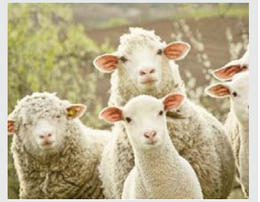
sëmundjes në territorin e Republikës së Kosovës.

Në njoftim theksohet se autoritetet kufitare do t'i forcojnë kontrollet në të gjitha pikat kufitare dhe zonat e brezit kufitar me Shqipërinë, me qëllim parandalimin e futjes së