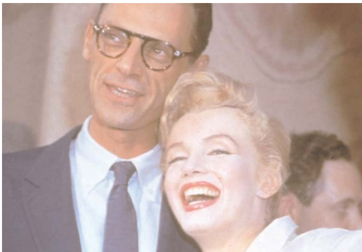
Në shtëpinë e Millerit në Roksbëri të Konektikatit, në vitin 1956, disa orë para dasmës së tyre.

Nga këndvështrimi i karrierës, ai ndiente se kishte kaluar katër vjetët e martesës së tyre “duke mos bërë në thelb asgjë,” përveç Të papërshtatshmit, dhe se edhe nëse ndjenjat e Monroes do të