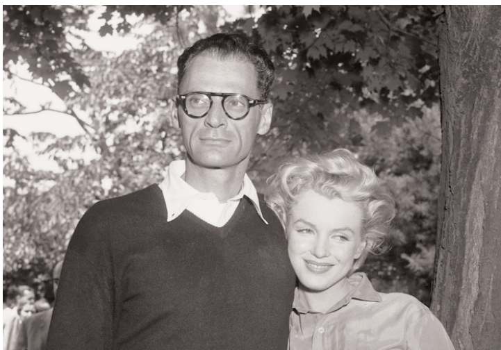
Në shtëpinë e Millerit në Roksbëri të Konektikatit, në vitin 1956, disa orë para dasmës së tyre.