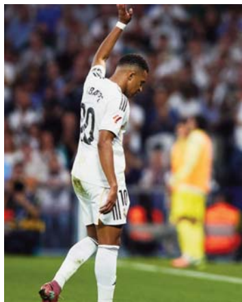
figura të rëndësishme të klubit që duhet të largohen gjatë verës, në kuadër të një "pastrimi" të dhomave të zhveshjes, të cilat nuk kanë qenë kurrë më të përçara. Edhe pse jo domosdoshmërisht si pjesë e një qëndrimi publik të Mourinhos, një nga emrat që po flirtin me idenë e largimit nga "Bernabeu" është pikërisht Kylian Mbappe. Francezi aktualisht gjendet në mes të një "lufte" të vazhdueshme me Jude

MADRID, 20 MAJ - Ditët e Kylian Mbappes si lojtar i Real Madridit duket se po shkojnë drejt fundit dhe një gjigant i Premierligës mund të jetë stacioni i tij i radhës. Pas lënies mënjanë nga grupet e miqësisë brenda kampit dhe një pritjeje të ashpër nga tifozët, madje me një petition online që kërkon largimin e tij, Mbappe mund të jetë gati ta mbyllë kapitullin në "Santiago Bernabeu". "Special One" është raportuar në medie se ka identifikuar tashmë disa