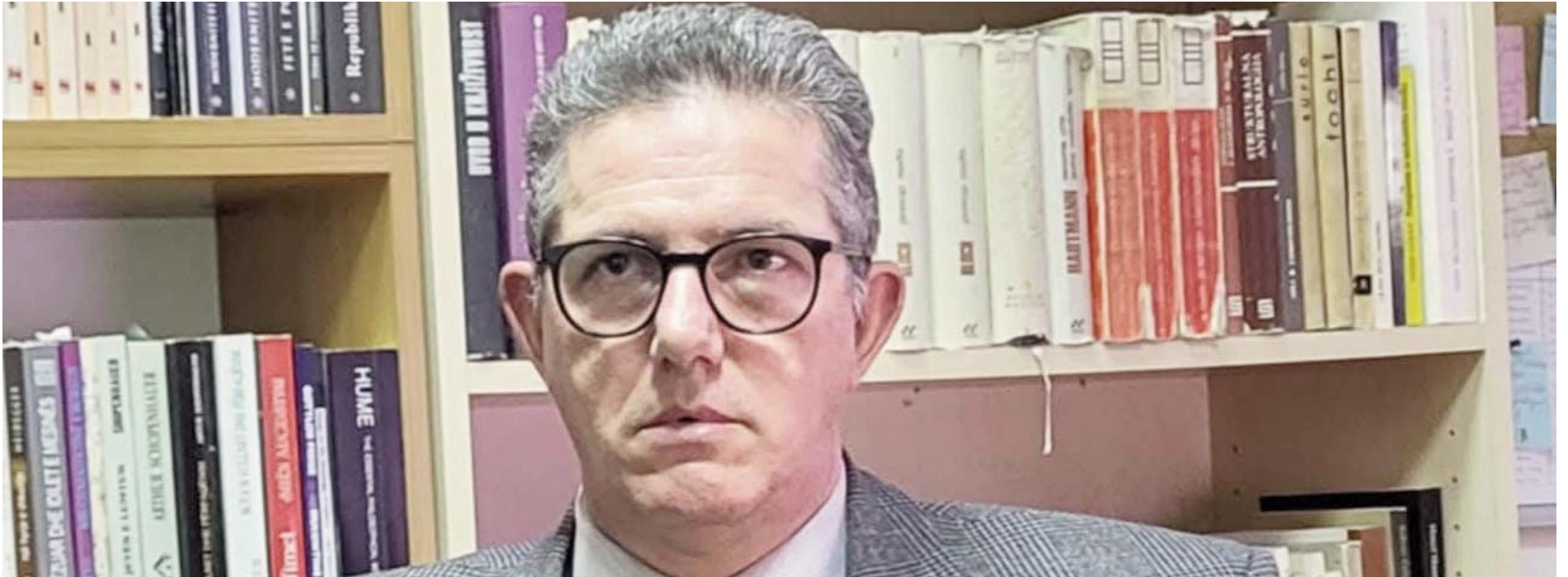
Shkruan: Arben HOXHA

Në fushatën zgjedhore që lamë pas, beteja e vërtetë politike nuk u zhvillua për programet politike dhe as rreth tyre. Beteja e vërtetë u zhvillua ndërmjet dy prirjeve karakterologjike të politikëbërjes: prirjes së egocentricitetit politik dhe prirjes së sinqeritetit politik. Të orientuara nga prirja e parë, partitë politike si VV-ja, PDK-ja, LDK-ja dhe AAK-ja, në debatet dhe tubimet zgjedhore, interesin e partisë apo edhe të liderit të tyre përpiqeshin ta paraqisnin si të njëjtë me interesin e popullit dhe të shtetit. Edhe kur provat ishin të pakundërshtueshme dhe qartazi të verifikueshme, kritikantët e ndërsjella konsideroheshin si sulme armiqësore ndaj imazhit të idealizuar që ato kanë për veten dhe për liderët e tyre. Të orientuara nga prirja e egocentricitetit politik, ato përpiqeshin që çdo sukses shtetëror, para opinionit publik, ta paraqisnin si sukses ekskluziv personal të liderit partiak ose të partisë që ai përfaqëson. E udhëhequr nga prirja e sinqeritetit politik, si tipar karakterologjik i politikëbërjes, e cila bazohet në tërësinë e përkushtimit dhe në vënien e të gjithë qenies në shërbim të së vërtetës, të drejtës dhe lirisë, PSD-ja në këtë fushatë ishte antidoti i prirjes së egocentricitetit politik.