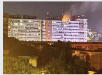
një vend anëtar i NATO-s, shkruan "ANSA".

raportuar "Faytuks Network". Sipas Shërbimit të Reagimit ndaj Emergjencave (ISU), droni ka rënë në një ndërtesë banimi dhe impakti ka shkaktuar një shpërthim që ka shkaktuar zjarr në një apartament në katin e dhjetë. Ministria rumune e Mbrojtjes ka konfirmuar se të premtet një dron rus ka goditur një ndërtesë banimi në Rumani,