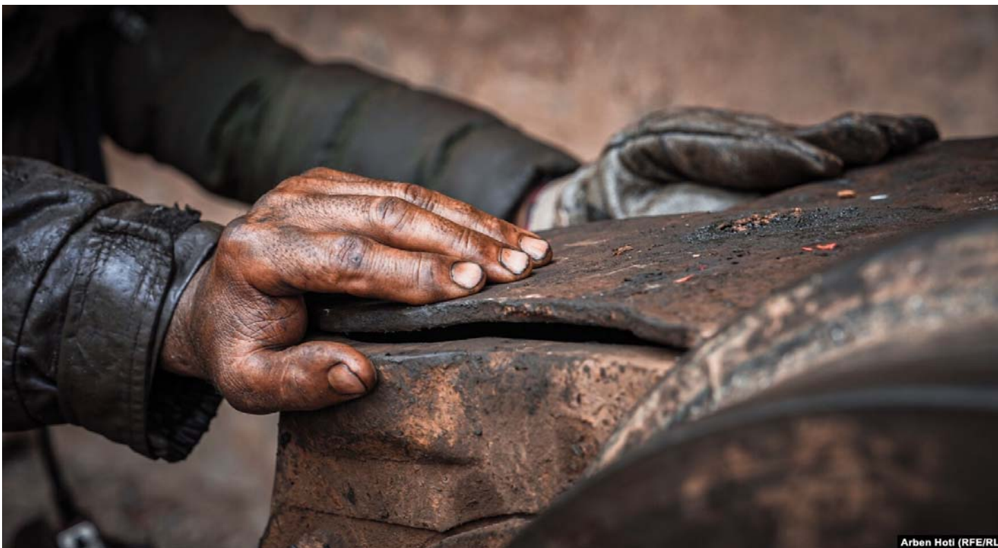
Arben Hoti (RFE/RL)

Punëtorë të kombinatit "Trepça" - ndërmarrje minerare në Kosovë - përballen me mospagesë të kontributeve pensionale tash e sa vite pavarësisht se ato u zbritën nga paga çdo muaj. Në disa raste në llogari figurojnë vetëm disa muaj të paguar brenda shumë viteve punë. Sindikata flet për shkelje ligjore dhe borxh prej miliona eurosh, ndërsa menaxhmenti i Trepçës pranon mospagesat që nga viti 2022, por nuk jep arsye apo afat për shlyerje të borxhit